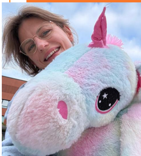
Avec son animal fétiche !