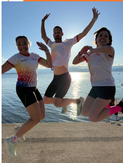
Youpi, le départ !