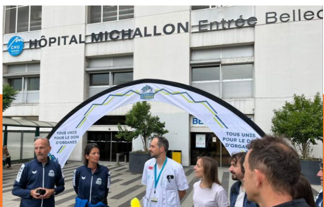
Temps fort ! Le don on en parle !!!