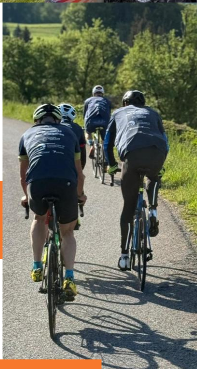
On roule !