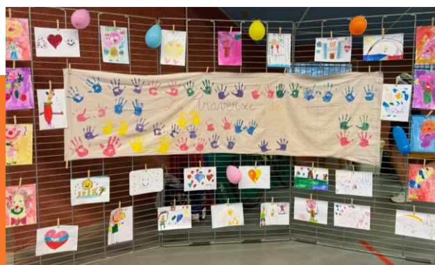
Les enfants aussi...