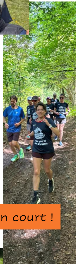
On court !