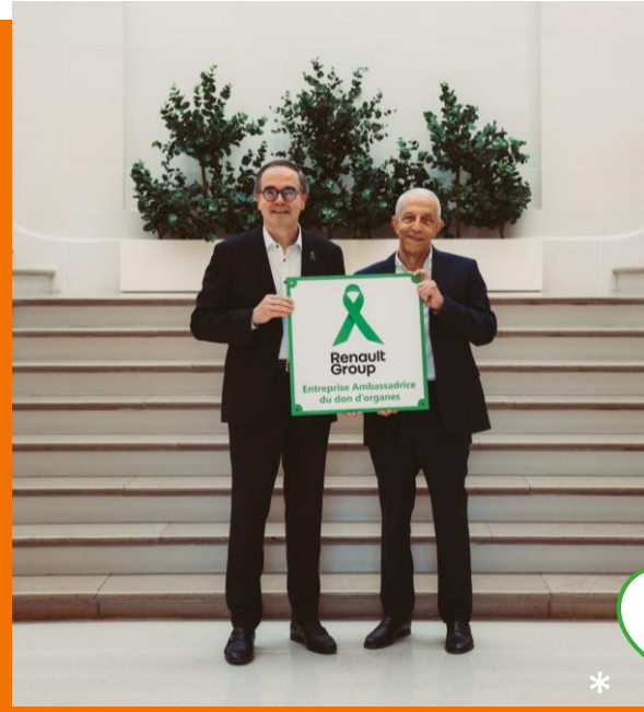
22 juin – journée nationale du don d'organes

Renault Group s'engage comme ambassadeur du don d'organes !