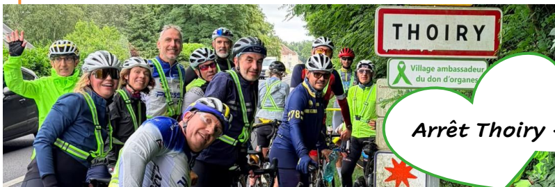
Arrêt Thoiry - Ville ambassadrice