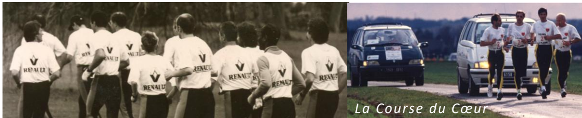
La Course du Cœur

1 ère équipe de coureurs Renault investie dans la cause du don