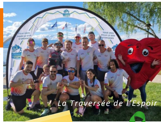
La Traversée de l'Espoir

1994 199 201 2023 Courses Expo Conférences Animations