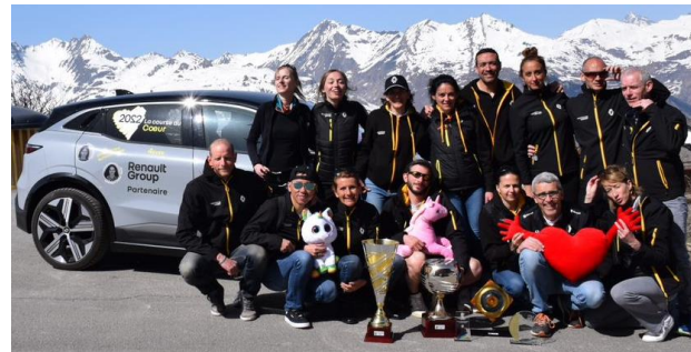
Equipe ES Renault 2022